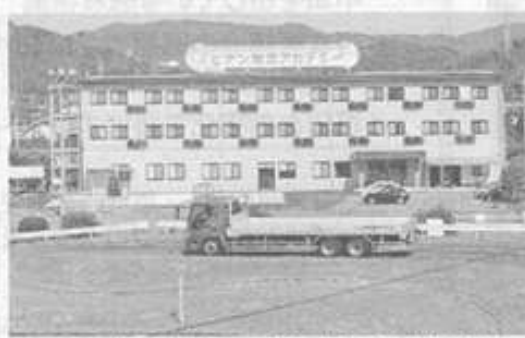
100人超が泊まれる合宿施設を持ち広く西日本から教習生を集めている(広島県福山市の備南自動車学校)

備南自動車学校は大型車に照準を定めた。同社は1961年に創業。18年7月期の売上高は約2億7千万円を見込む。116人収容の合宿施設を持ち、広く西日本から教習生を集める。大型車の講習は1日2時間が限度だが、合宿の空き時間にフォークリフトや玉掛け技能、運行管理者など複数の講座を受講でき、最短12日間で6種類の資格を取得できる。